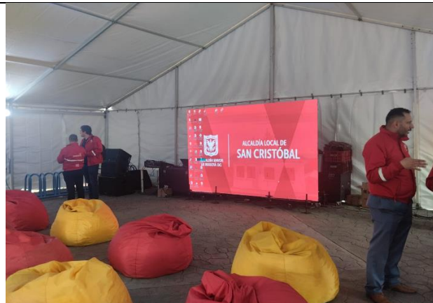
Además más de 2000 personas siguieron la rendición por Facebook live.