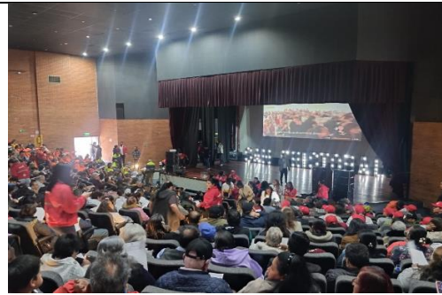
Más de 600 personas estuvieron de manera presencial, CDC La Victoria.